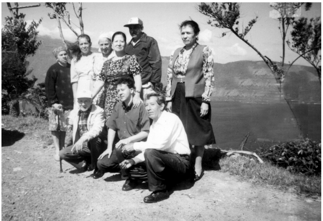
Familia Mebius, rumbo al Cerro Verde Santa Ana. Culto de Acción de Gracias en las Lomas de San