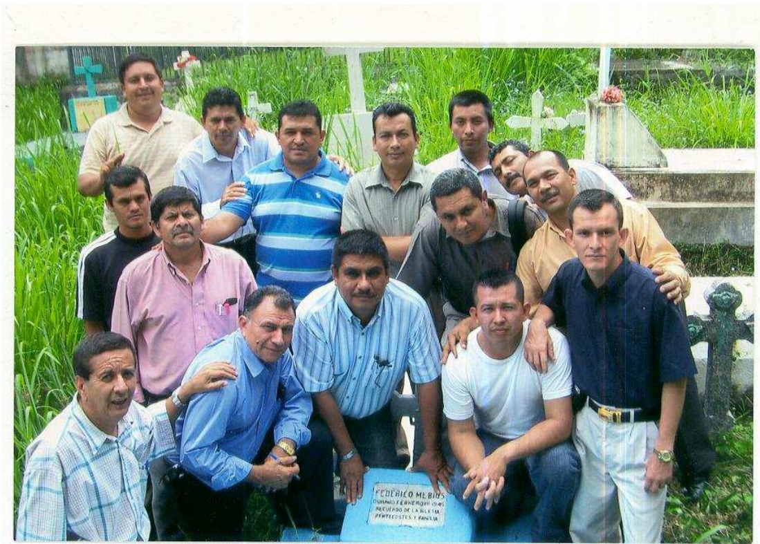
Alumnos de 6º años del Instituto Bíblico IBAP. Visitan la tumba del profeta salvadoreño Federico Mebias. Septiembre de 2007. Les acompaña el maestro de la materia. Historia de la iglesia Evangélica salvadoreña.

El 21 de agosto de 2007 junto a 15 estudiantes del Instituto Bíblico I:B:A:P estudiantes de la materia historia de la iglesia evangélica salvadoreña visitamos el mausoleo de hermano Federico. Comentamos que él nunca fue ordenado por los hombres pero fue seleccionado en el cielo para llevar las buenas nuevas de gran gozo a los cuscatlecos. El bautismo en agua fue cuando era bebé, según partida